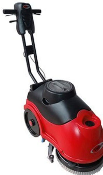
A kép illusztrációként szolgál.